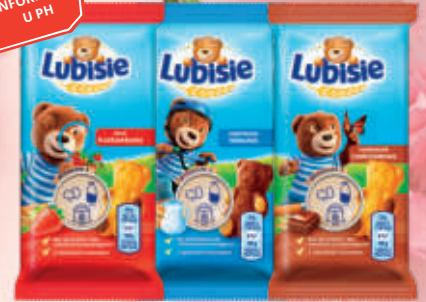
LUBISIE 30G ASORTYMENT