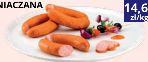
K. ZŁOTA GRILLOWA