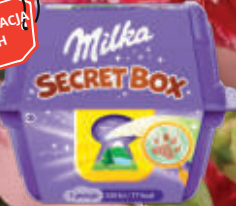
MILKA SECRET BOX