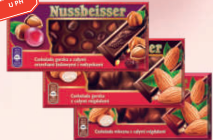
CZEKOLADA NUSSBEISER 100G ASORTYMENT