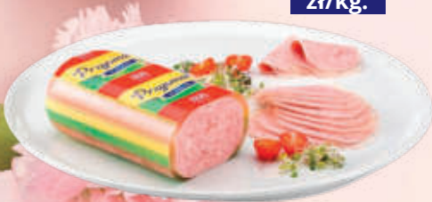
PRZYSMAK W KONSERWIE