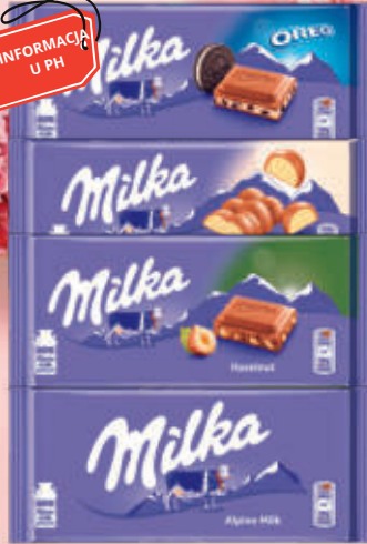
MILKA 85-100g ASORTYMENT