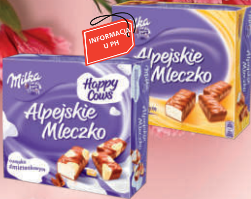
MILKA ALPEJSKIE MLECZKO ASORTYMENT